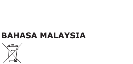
Символът със задраскан кош за отпадъци означава, че артикулт следва да се изхвърли отделно от битовите отпадъци. Артикулт трябва да бъде предаден за рециклиране в съответствие с местните правила за изхвърляне на отпадъци. Като отделяте обозначените артикули от битовите отпадъци, вие спомагате за намаляването на количествата отпадъци, предавани в сметища или за изгаряне, и свеждате до минимум потенциалните отрицателни въздействия върху човешкото здраве и околната среда. Моля, обърнете се към магазин ИКЕА за повече информация.

Simbol roda berpangkah menunjukkan item ini harus dilupuskan berasingan daripada bahan buangan isi rumah. Item ini sepatutnya diserahkan untuk dikitar semula selaras dengan peraturan alam sekitar tempatan untuk pelupusan sampah. Dengan mengasingkan item bertanda daripada bahan buangan isi rumah, anda akan membantu mengurangkan jumlah bunagan yang dihantar ke tapak pelupusan dan meminimumkan kesan negatif yang berpotensi ke atas kesihatan manusia serta alam sekitar. Untuk maklumat lanjut, hubungi gedung IKEA anda.