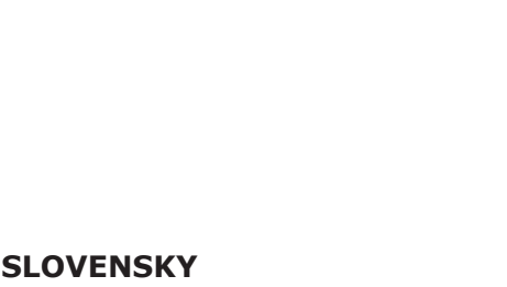
The crossed-out wheeled bin symbol indicates that the item should be disposed of separately from household waste.

Az áthúzott, kerekes szemetest ábrázoló szimbólum azt jelzi, hogy a terméket a háztartási hulladéktól különválasztva kell elhelyezni. A terméket a helyi szabályozásnak megfelelően, újrahasznosítás céljából a megfelelő helyen kell leadni. Azzal, hogy az így jelölt termékeket a háztartási hulladéktól különválasztod, segítesz csökkenteni a hulladékégetőkbe kerülő vagy a földben elhelyezett szemét mennyiségét, ezzel minimalizárod az egészségre és a környezetre ártalmas lehetséges negatív hatásokat. További információkért kérjük, lépj kapcsolatba a legközelebbi IKEA áruházal!